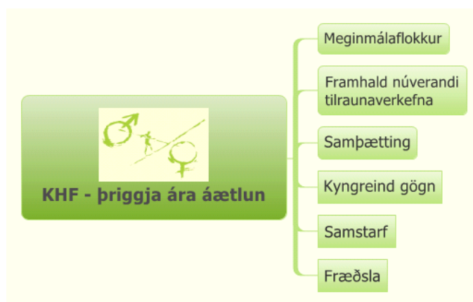
Mynd 1: Yfirlit yfir tillögur verkefnisstjórnar

Í þessum hluta eru tillögur verkefnisstjórnar um hvernig standa skuli að áframhaldandi innleiðingu kynjaðrar hagstjórnar og fjárlagagerðar. Á mynd 1 er yfirlit yfir tillögur verkefnisstjórnar um áframhaldandi innleiðingu kynjaðrar hagstjórnar og fjárlagagerðar og er hverjum flokki lýst nánar hér á eftir. Í viðauka II er síðan yfirlit yfir lykilþátttakendur í innleiðingunni.