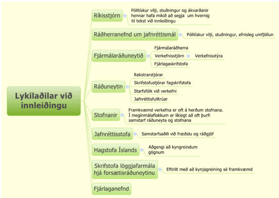
Mynd 3: Lykilaðilar við innleiðingu