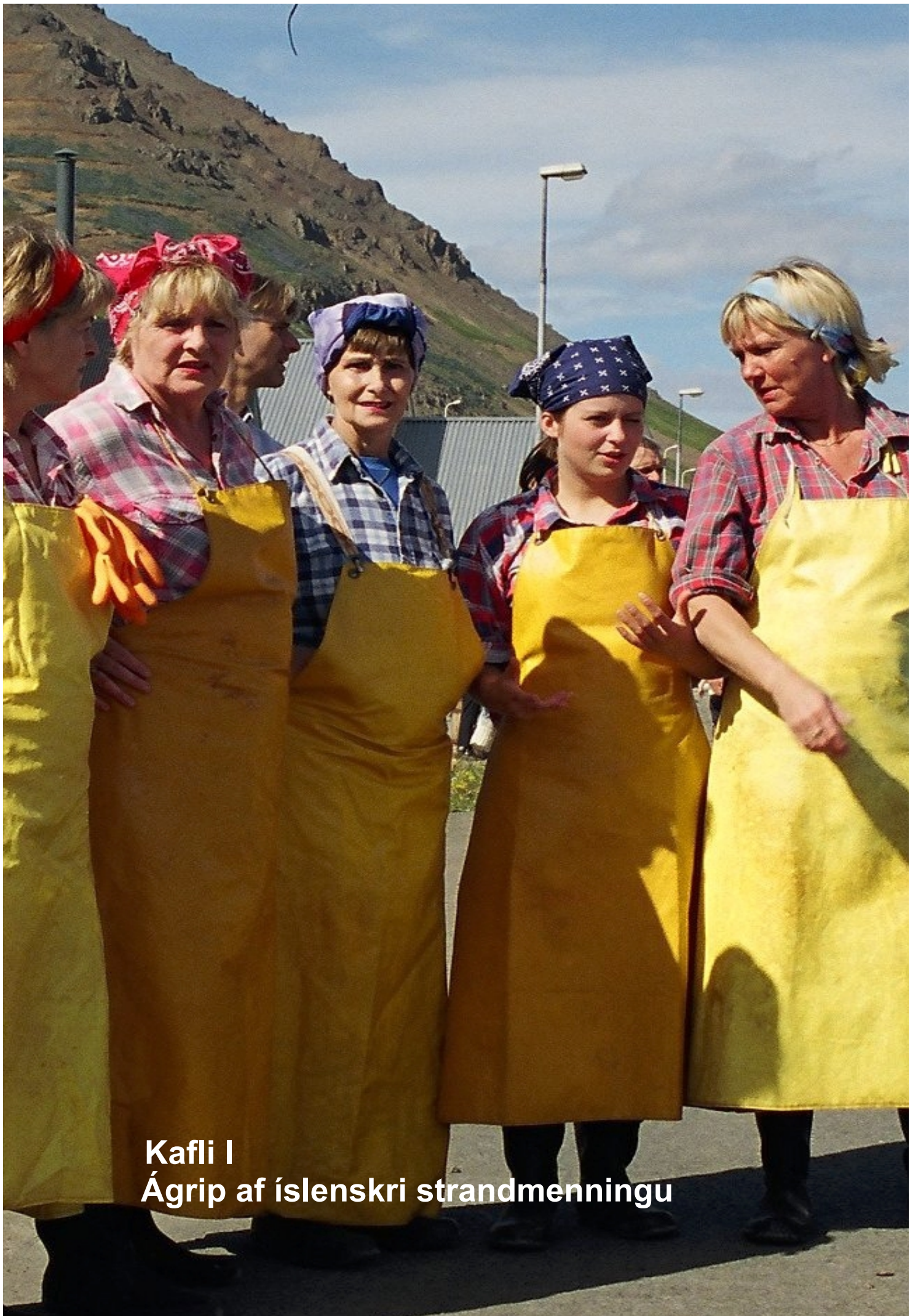
Kafli I Ágrip af íslenskri strandmenningu