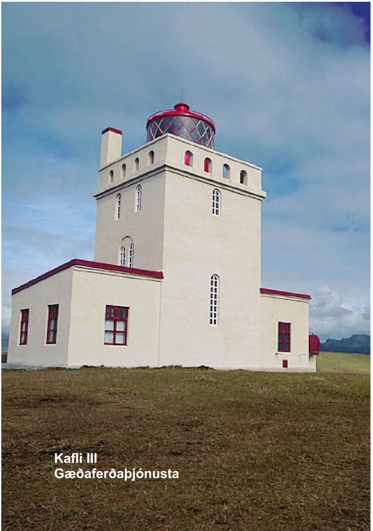
Kafli III Gæðaferðapjónusta